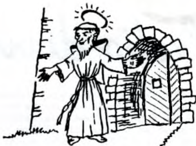
BENVENUTI NEL MONASTERO?